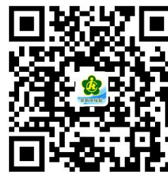
市残联权力事项清单